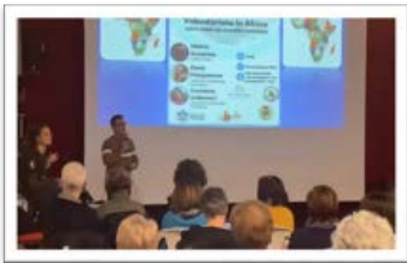
La serata presso la parrocchia di Villagrappa

È una realtà molto diversa da quella a cui siamo abituati.. . chi è malato non sempre può essere guarito, in ospedale il vitto non è garantito, te lo devi procurare, e anche le lenzuola vanno portate da casa. Si partorisce su una sedia e gli aborti con raschiamento sono senza anestesia. Nulla è scontato, nemmeno sopravvivere.