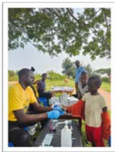
I test sui bambini

E così sono partite, abbandonando i comfort e la sicurezza del tetto di casa, volando in un altro continente per mettersi in gioco. Senza acqua calda, senza automobili, con l'energia elettrica centellinata e una dieta basata su fagioli, patate, riso e cavolo.